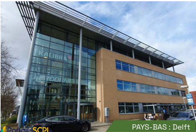
PAYS-BAS : Delft