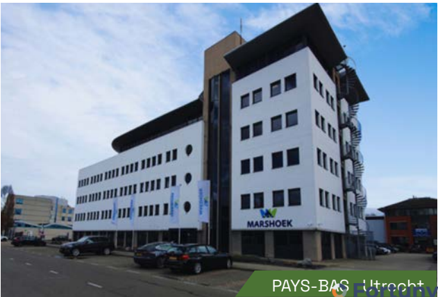
PAYS-BAS : Utrecht